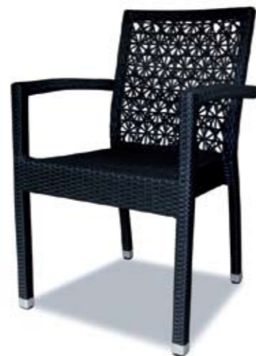
SAM S CVIJETOM 58x64x45/88