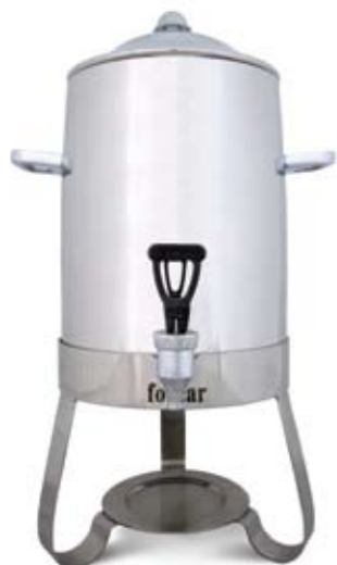
DISTRIBUTER NAPITAKA TOPLI DC 10502