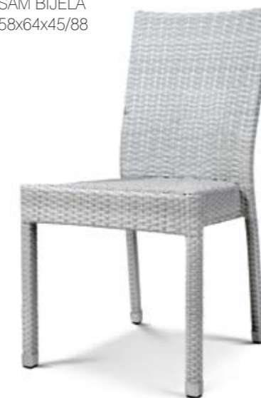
SAM BIJELA 58x64x45/88