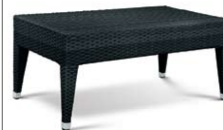
STOLIĆ APFEL 90x50x46