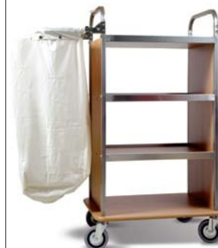
KOLICA ZA SOBARICE