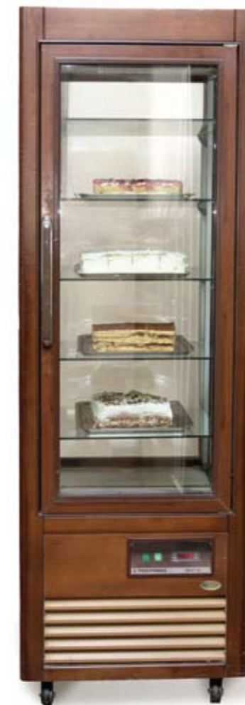
VITRINA ZA KOLAČE