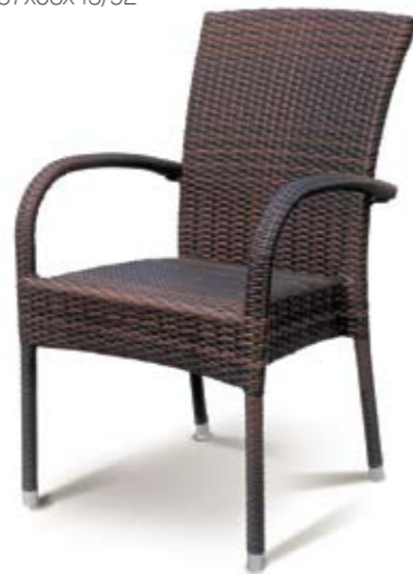
RIVA R 57x63x45/92