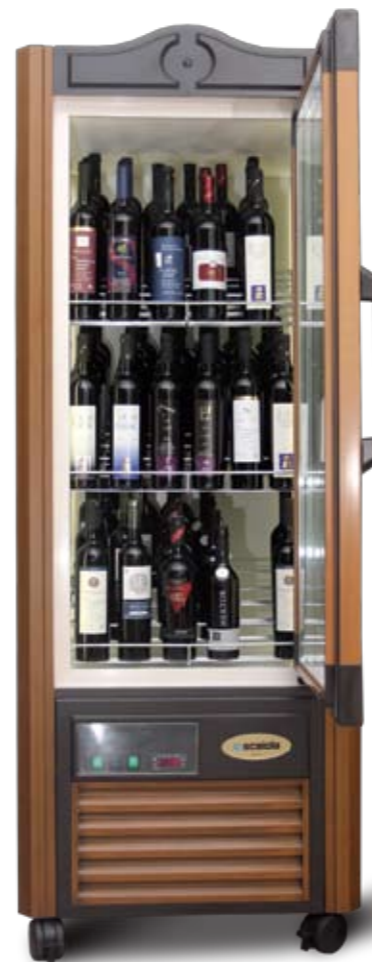
VITRINA ZA VINO