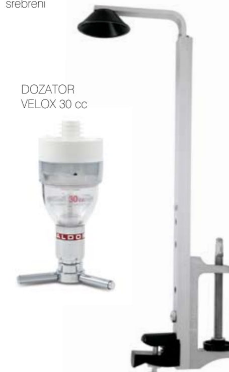
DOZATOR VELOX 30 cc