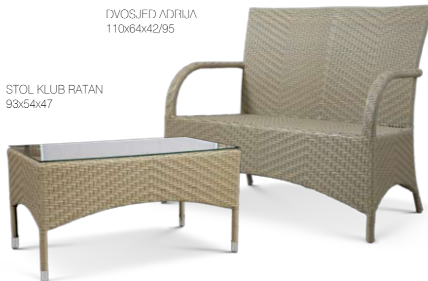
STOL KLUB RATAN 93x54x47