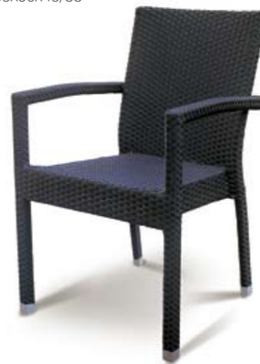
SAM CRNA 55x60x45/88