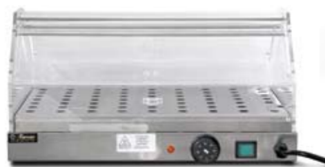
GRIJANA VITRINA VBR 4751